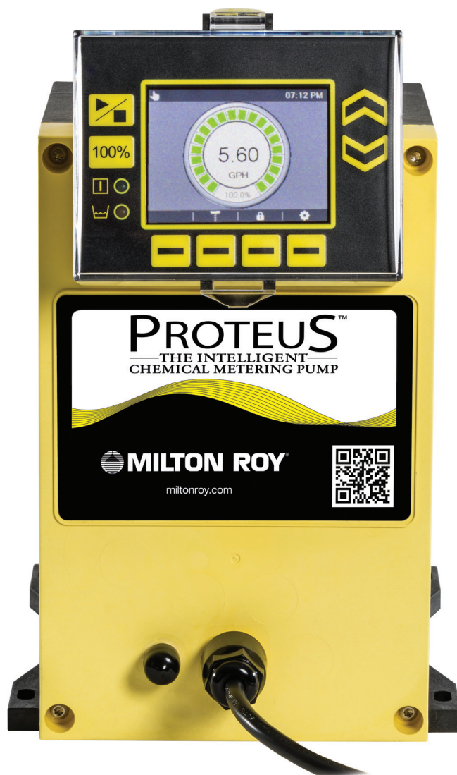
Version présentée : Version Communication

Le choix de votre pompe n'a jamais été aussi facile. Nul besoin de configurations compliquées pour trouver la pompe parfaite pour votre application. Avec les versions Manuelle, Enrichie et Communication, choisissez simplement les caractéristiques qui correspondent à vos besoins (liste complète en page 6). Ces modèles offrent un large éventail de fonctionnalités, avec entre autres un écran rétroéclairé, plusieurs langues de navigation et la communication bidirectionnelle.