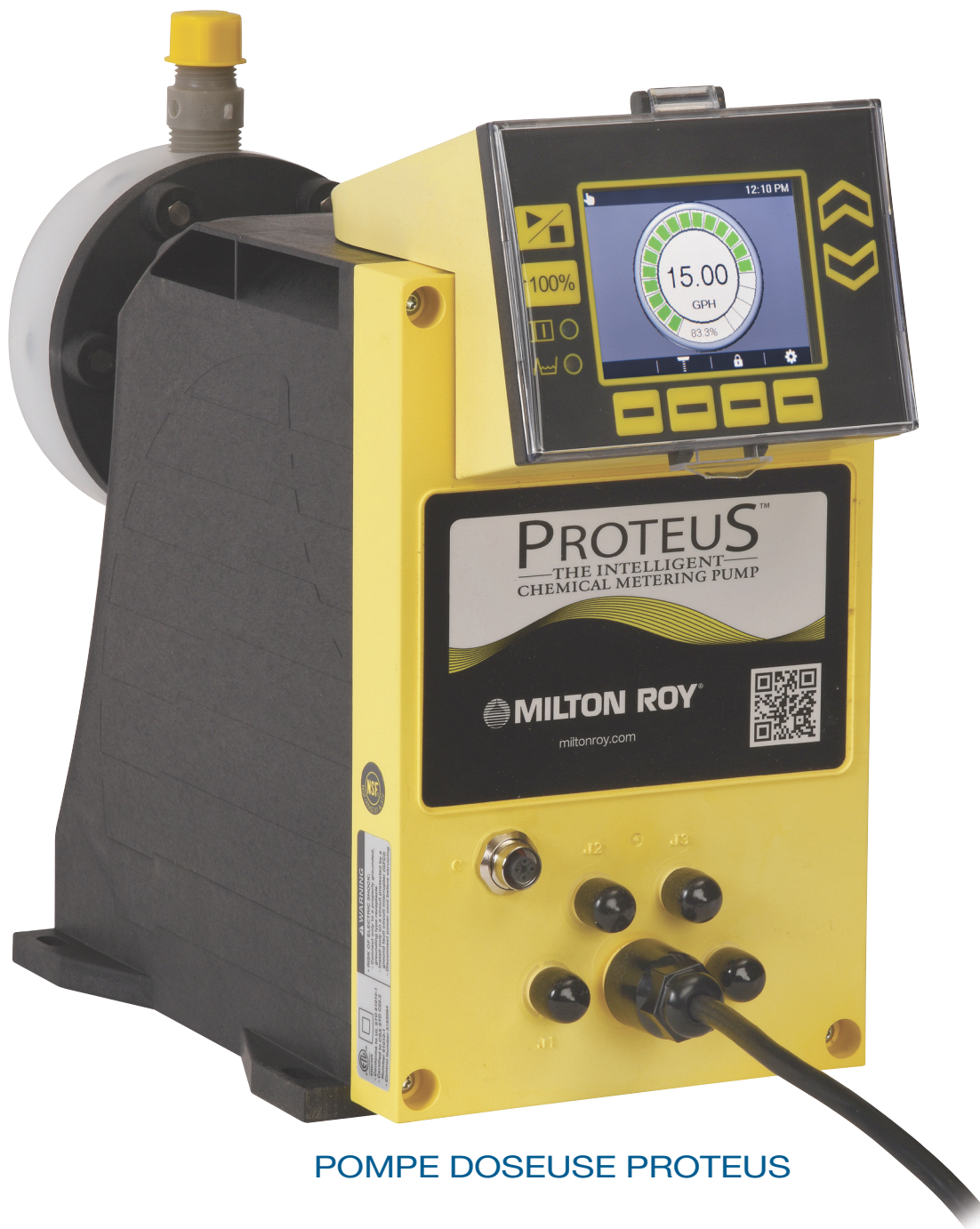
POMPE DOSEUSE PROTEUS